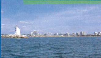
Le nautisme à la Grande-Motte