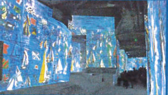
Nouveau spectacle aux "Carrières de Lumière"