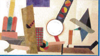
Herbin au Musée de Céret