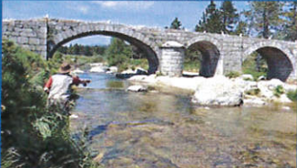
La pêche en Lozère