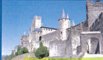
La Fête au Pays carcassonnais