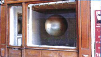
La M'estra de Mende