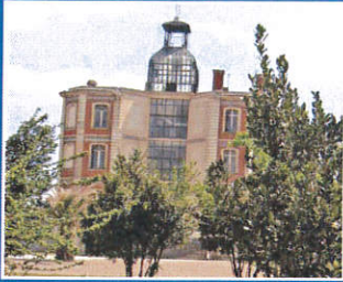
La Maternité Suisse d'Elne Pleins Feux : p.12