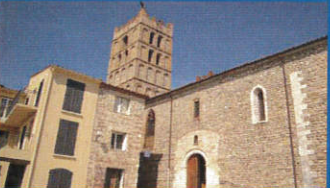
La cathédrale d'Elne