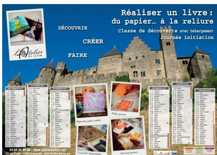
Partenariat Moulin à Papier de Brousses et Atelier du Livre.