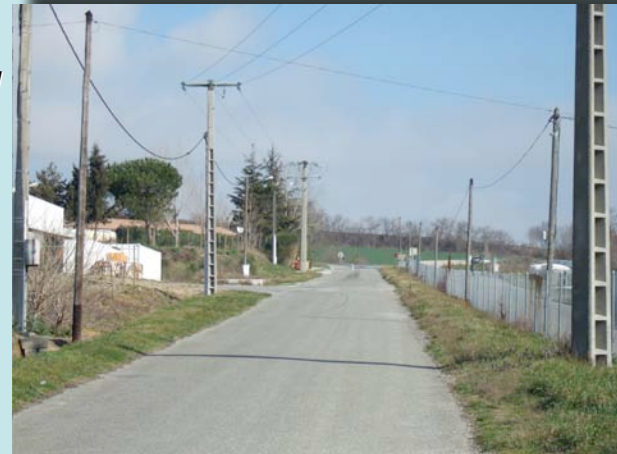
ZI de Montréal