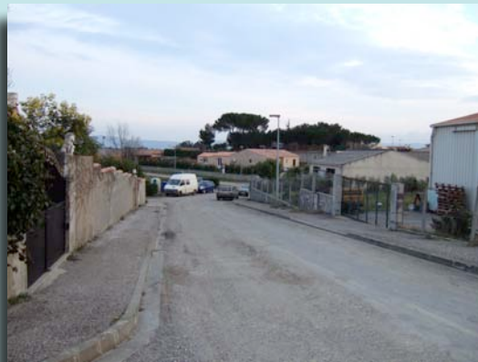
ZA de Conques sur Orbiel