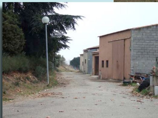
ZA de Caunes Minervoises