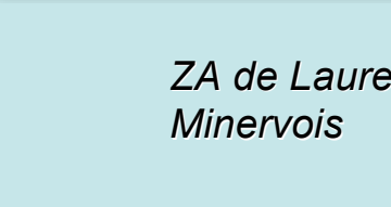
ZA de Laure Minervoises