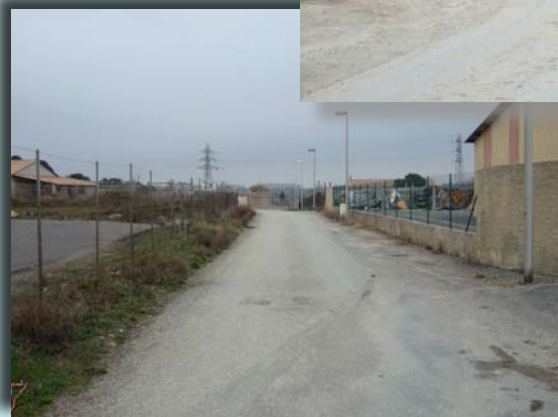
ZA de Capendu