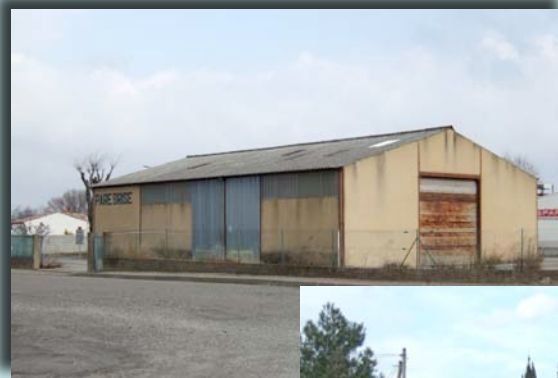
ZA de Peyriac Minervois