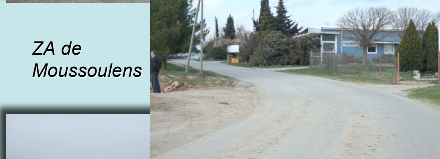
ZA de Moussoulens