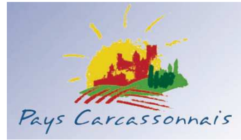
Schéma territorial des infrastructures économiques du Pays Carcassonnais