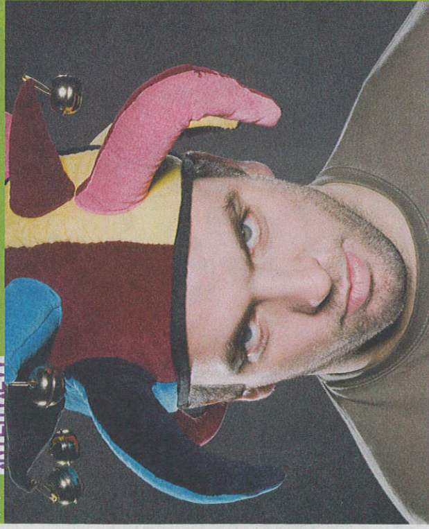
LE COMTE DE BOUDERBALA, au Zénith, samedi 30 à 20h30. Prix: 33 euros.