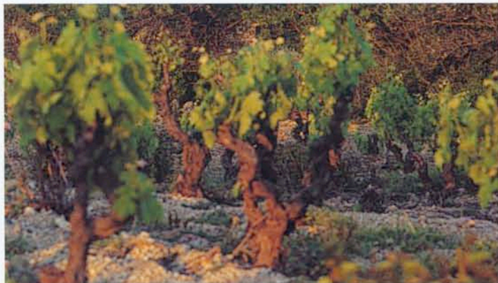
Un pôle viticole majeur

Les conclusions de chaque commission, différents points ont été mis en évidence par les participants